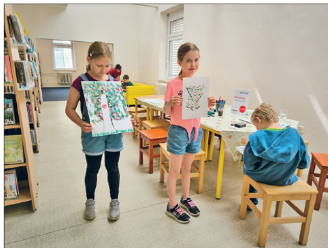
VÝTVARNÁ DÍLNA Strom života v pobočce knihovny Daliborova se konala v rámci akce Dny fajn rodiny.