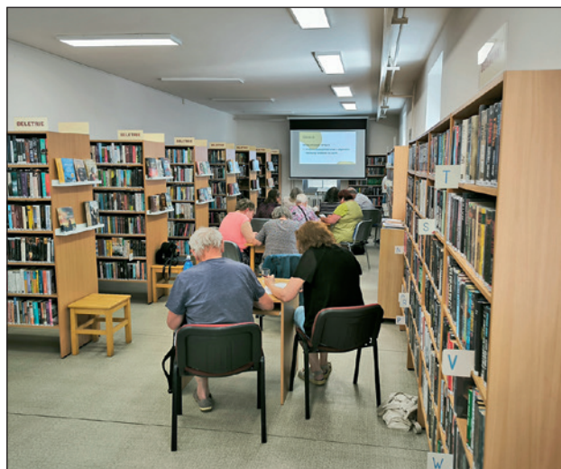
V BŘEZNU zahájíme další cyklus trénování paměti. Uvidíme se 12. a 24. 3. 2026 v 10.00 v pobočce J. Trnky a v 16.30 v pobočce Daliborova.

Program je určen malým dětem i jejich (pra)rodičům a probíhá v klidné, hravé atmosféře.