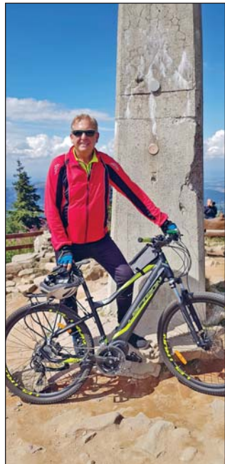
PŘI LETOŠNÍM výjezdu na Lysou horu

V Mariánských Horách jsem se narodil a také jsem zde pracoval v bývalé PNS – distribuci novin a časopisů – až do roku 1990. Hned po sametové revoluci jsem si jako