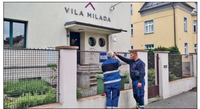
TABULE s názvy ulic v Mariánských Horách a Hulvákách se postupně vyměňují. Opatřované a často také poškozené cedule nahrazují nové označníky, tentokrát například v ulici Boleslavově.

Odpoledne od 14 hodin program na Mariánském náměstí pokračuje 20. ročníkem festivalu Bluegrass Džem, na kterém vystoupí šest kapel z regionu i zahraniční hosté.