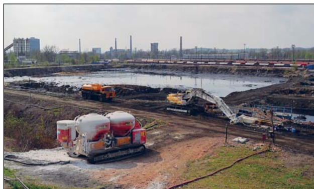
AREÁL ostravských lagun Ostramo.

O dalším vývoji ve věci kompenzaci pro obyvatele městského obvodu Mariánské Hory a Hulváky za snížený standard životního prostředí v souvislosti s výskytem a likvidací ropných lagun vás budeme informovat v dalších vydáních Zpravodaje.