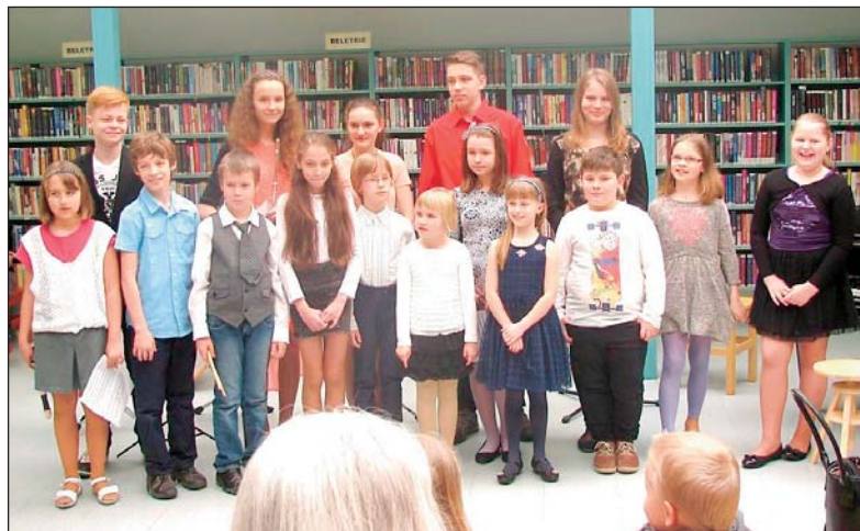
SPOLEČNÁ FOTOGRAFIE účinkujících žáků Základní umělecké školy Eduarda Marhuly na koncertě s názvem „S úsměvem u klavíru“, který se uskutečnil ve čtvrtek 14. dubna od 17 hodin v pobočce knihovny na Fifejdách.

Na prázdninové měsíce jsme pro vás připravili výstavu výtvarných prací klientů Čtyřlístku – centra pro osoby se zdravotním postižením Ostrava, bude k vidění od 4. června do 31. srpna.