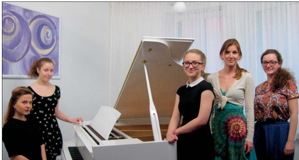
ABSOLVENTSKÝ koncert se konal 12. dubna.