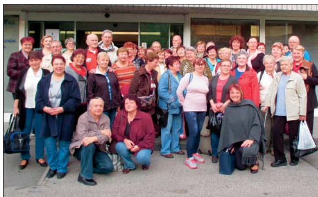
ÚČASTNÍCI prvního turnusu zájezdu do Lázní Darkov.

velmi potěšilo, jak byli vděční, že jsme jim takový zážitek umožnili,“ uvedla místostarostka obvodu Jana Pagáčová, která má ve své gesci sociální věci. „Naše snaha pomoci seniorům žít aktivně zájezdem do lázní nekončí. Na podzim pro ně uspořádáme další velký výlet,“ dodala místostarostka.