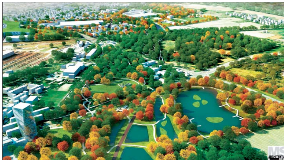
VIZUALIZACE projektů navržených v území Benátek.