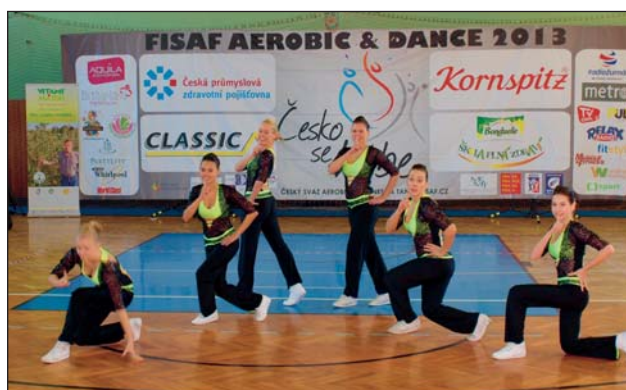
ČLENOVÉ FIT & FUN studia Ostrava na závodech sportovního aerobiku.

V roce 2013 jsme finanční dar ve výši 15 tisíc korun od městského obvodu Mariánské Hory a Hulváky použili na úhradu nákladů spojených s vybavením zázemí šaten pro děti a mládež našeho sportovního studia.