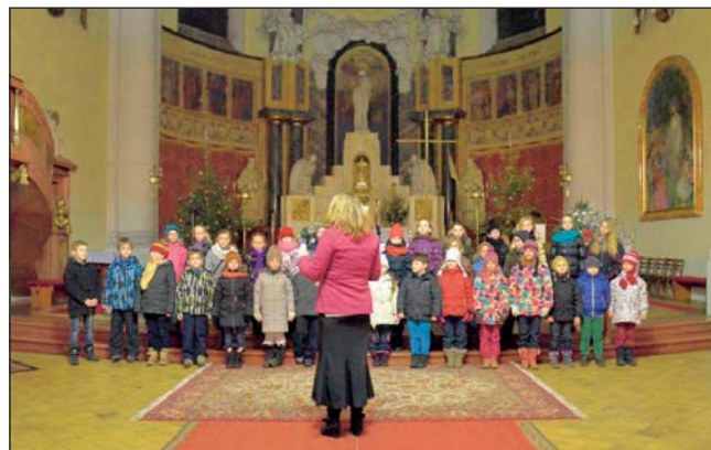
NOVOROČNÍ KONCERT ZUŠ Eduarda Marhuly v kostele Panny Marie Královny v Mariánských Horách.

V pátek 10. ledna se uskutečnil Novoroční koncert naší školy. Je dlouholetou tradicí, že se tento koncert koná v kostele Panny Marie Královny v Mariánských Horách, a také že na tomto koncertě účinkují učitelé a jejich hosté. Letos jsme tuto tradici poprvé porušili. Krásnému prostoru kostela jsme zůstali věrní, ale mezi účinkujícími byly vidět nové tváře. Začátku a konce našeho koncertu se zhostila přípravná oddělení Ostravského dětského sboru – Slavíci společně s Kosy a Skřivánky. Naplněný kostel pak vyslechl a odměnil potleskem vystoupení dětí i účinkujících učitelů. Děkujeme všem kolegům, kteří se koncertu zúčastnili jako účinkující, korepetitóri, vedoucí souborů, i všem, kteří pomohli s náročnou organizací tohoto krásného večera. Více fotografií a videa z tohoto koncertu najdete na stránkách školy www.zus-ostravamarhory.net .