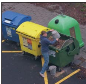
FOTOGRAFIE upravena v souladu se zákonem o ochraně osobních údajů.

Neustále řešíme problémy s lidmi, kteří nejsou ochotni třídit odpad. Možná jen nevědí o službě, kterou si stačí objednat. Asi před dvěma měsíci jsem uklízela ve sklepě starý nábytek a různé další nepotřebné věci. Protože jsem nevěděla, co s nimi, napadlo mne zavolat do společnosti OZO, která se odvozem odpadu zabývá, a objednala si jejich službu. Stačí nahlásit jméno a adresu, domluvit si potřebný termín a máte uklizeno. Tato služba se sice platí, ale není to žádná závratná suma, řidiči jsem zaplatila dvě stě korun. Paradoxní je, že lidé sociálně slabší anebo důchodci si tuto službu harampádí raději vyhodí tam, kam nepatří. Je to zbytečná snaha všech ostatních občanů, kteří poctivě odpad třídí? Nedávno jsem zachytila nepoctivce, který do kontejneru na komunální odpad sypal stavební suť. Protože to bylo již po