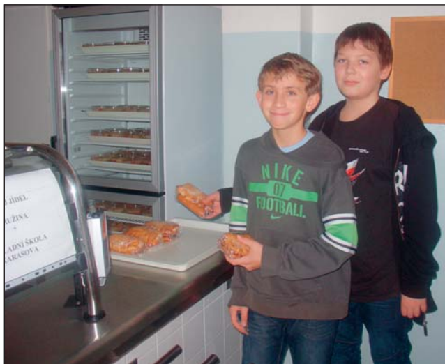
NA SVAČINKY jsou v Základní škole Gen. Janka žáci zvyklí.