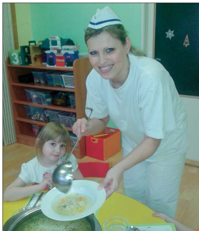
DĚTEM v Mateřské škole Gen. Janka chutnají nejen polévky.