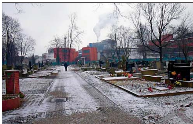
POHLED na část hřbitova po kácení stromů.

Od 13. ledna do konce února na mariánskohorském hřbitově probíhá plánované kácení stromů a následné odstraňování pařezů a kořenů. Upozorňujeme občany, aby v těchto dnech dbali zvýšené pozornosti a nevstupovali do bezprostřední blízkosti kácených dřev. Po dokončení prací budou provedeny terénní úpravy.