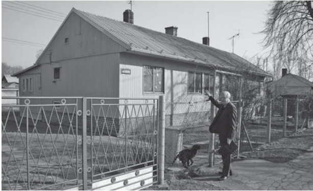
SVÝM osobitým životem žije lokalita Bedřiška.

Druhou lokalitou, která žije svým osobitým životem, je osada Bedřiška. Vedle romských