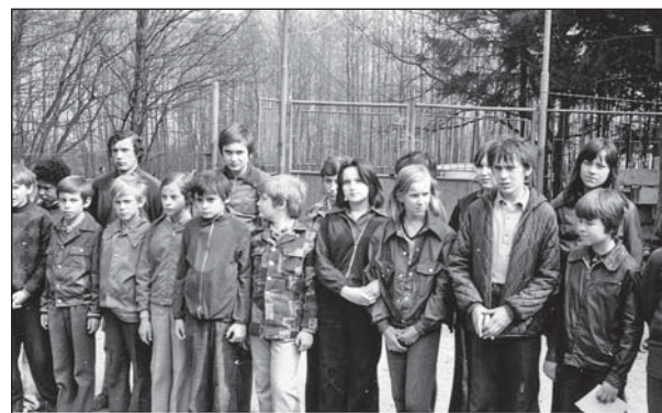
Na rybníku v "Benátkách" 1977