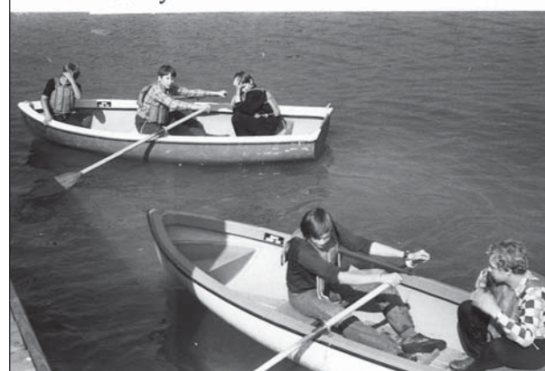
DOBOVÉ FOTOGRAFIE žáků z tehdejší Základní devítileté školy Podlahova na výletu v Benátkách v roce 1977.