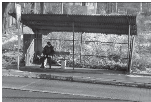
TAKTO VYPADAL původní přístřešek na zastávce Vršovců.

umístili na trase trolejbusových linek číslo 102 a 108 na zastávce Vršovců. Druhý je umístěn na zastávce autobusové linky číslo 24 Zelená. Tato nemalá investice je přínosem pro občany našeho obvodu, a proto doufáme, že nám přístřešky vydrží nepoškozené mnoho let,“ zmínila Gabriela Veselá z úseku místního hospodářství a dopravy.