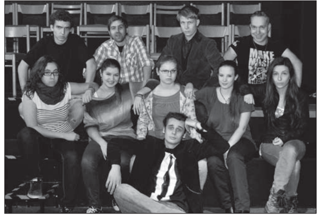
NOVÉ ostravské divadlo P.A.S.T. zahajuje 7. března v divadelním sále Stará Aréna.