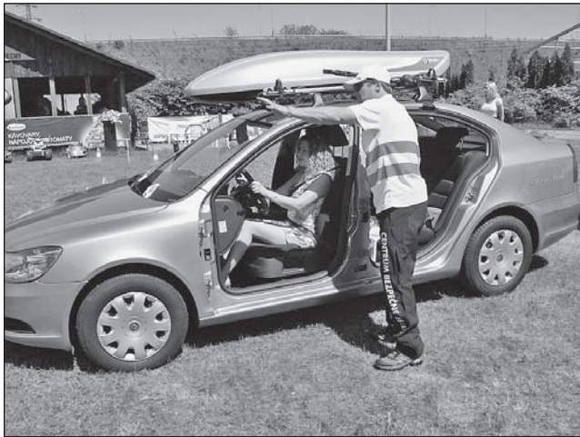
V KURZU se ženy naučí, jak správně sedět za volantem.

Ne, nemýlíte. Kurzy pro ženy děláme moc rádi. Ženy jsou mnohem zodpovědnější nejen jako řidičky, ale také jako klientky. Přicházejí s tím, že nevědí, do čeho jdou. Už během teoretické části, která probíhá formou dialogu, se ptají na všechno, co