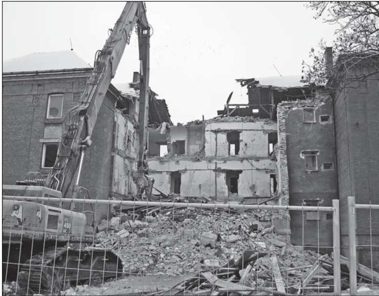
DNE 9. LEDNA zahájila společnost DAV, a. s., demolici domu.