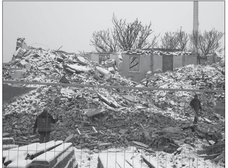
POMÁHALA těžká technika, ale stavební materiál třídili pracovníci vlastníma rukama.