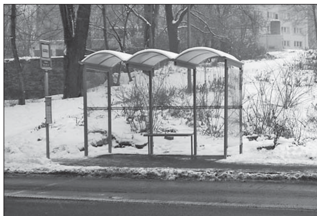
NOVÝ PŘÍSTŘEŠEK na zastávce Zelená.