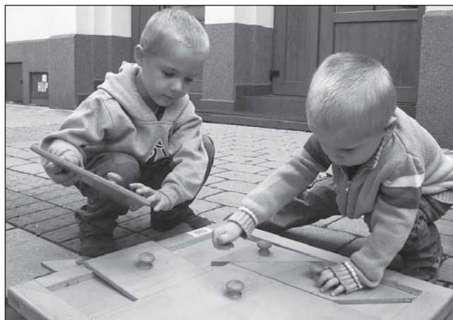
BĚHEM AKCE se děti pobavily, zasoutěžily si a vyhrály řadu cen.

„Upozorňujeme občany této oblasti, že po přerozdělení působnosti Policie ČR náleží tato lokalita do správy pobočky služebny PČR ve Vítkovicích. V případě problémů tedy volejte na telefonní číslo 974 725 771 nebo linku 158,“ zdůraznila starostka Liana Janáčková.