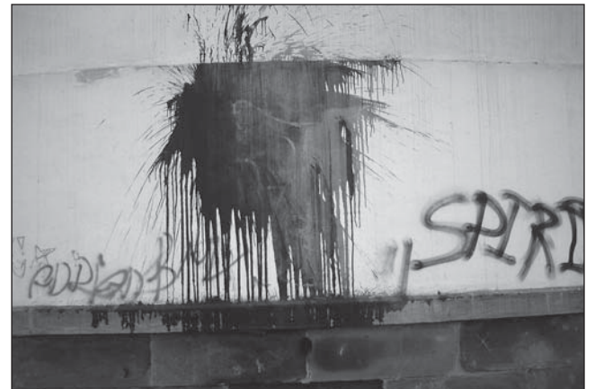
ČERSTVÉ STOPY vandalizmu nese zničená fasáda na straně presbytáře kostela Panny Marie Královny v Mariánských Horách.