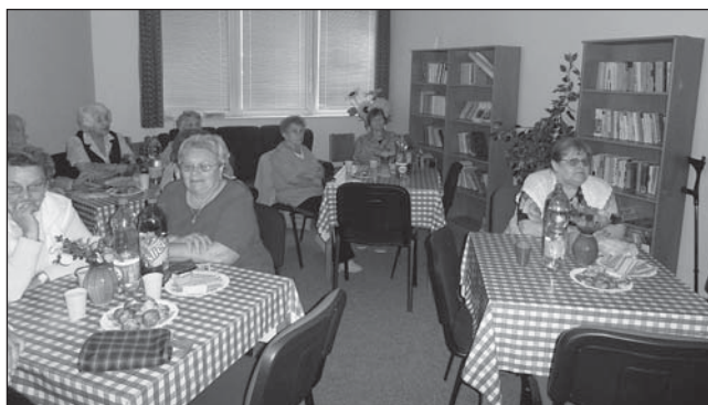
DPS ŠIMÁČKOVA nabízí také příjemné prostředí a zábavu.