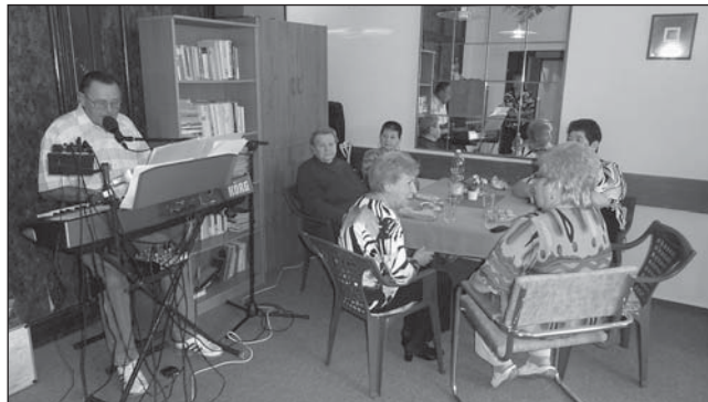
DPS NOVOVESKÁ připravuje pravidelné akce s programem.

Služby a akce jsou určeny nejen obyvatelům DPS!