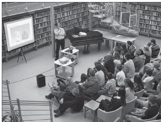
O PŘÍNOSECH otevřené internetové encyklopedie diskutovali žáci sedmých až devátých tříd.

„Od podzimu k adventu“ je název výstavy ručních prací technikou patchworku A. Chromíkové a dalších patchworkářek. Vernisáž se koná v pondělí 12. 11. v 17 hodin v prostorách dospělého oddělení knihovny.