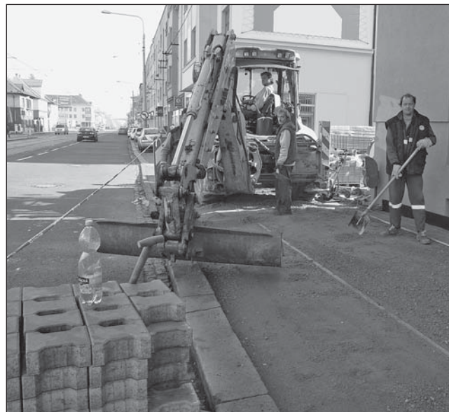
RADNICE NECHALA opravit poničený chodník u tramvajové zastávky Daliborova na ulici 28. října.