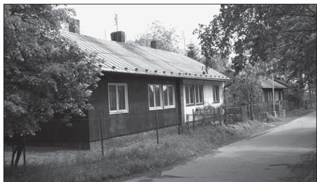
Ilustrační foto - osada Bedřiška

Úryvek z blogu Břetislava Olšera. Více viz: http://olser.cz/