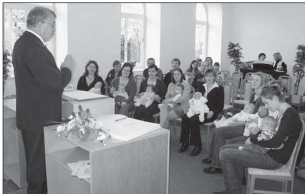
Vítání občánků 6. 12. 2008

V roce 2008 Úřad městského obvodu Mariánské Hory a Hulváky vítal občanky pětkrát, a to v březnu, květnu, červnu, listopadu a naposledy v prosinci 2008. Celkem na tzv. Vítání občánků bylo pozváno 146 dětí. Se svými rodiči, prarodiči, tetami, strýci došlo na radnici v kočárcích 115 „mrňat“. Všechny krásnými písněmi přivítali žáci a žákyňe Umělecké školy Eduarda Marhuly z Ostravy-Mariánských Hor. Ještě jednou všem holčičkám a chlapečkům přejeme do života hodně lásky, zdraví i rodinného štěstí. (red)