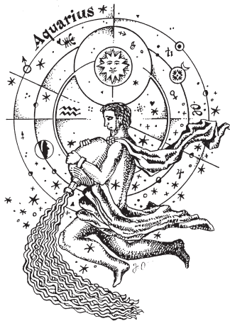
Kresba: Jindřich Olš

Jejich živlem je vzduch, kovem olovo a měď. Nejvíce si rozumí s lidmi ve znamení Blíženců a Vah. Vodnář by se měl starat o své