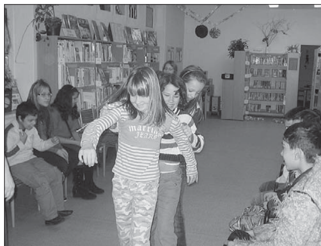
Čertí karneval U čerta.