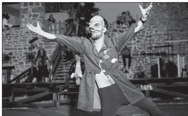
Z představení „SEN...“ DIVIDLA Ostrava