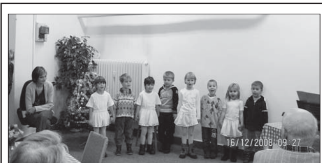
Předvánoční vystoupení dětí z Křesťanské mateřské školy - U Dvora 22, které proběhlo v DPS Šimáčkova 27 dne 16. 12. 2008 v 9.30 hod. Ve stejný den proběhlo ještě v 10.30 hod. druhé vystoupení v DPS Novoveská 14.