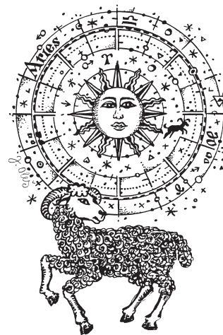
Kresba: Jindřich Oleš

Pro partnerství představují silní Berani mírné obtíže – vyžadují, aby bylo po jejich, část si v partnerství dělá co chce. Plusové, hlavně pro protějšky – ženy, může být jejich nezdolná potřeba si vzájemně sympatie vyjádřit a vyřkat. Jestliže se zamiluje, jde bezhlavě za svým srdcem a city, dokáže být milý a pozorný.