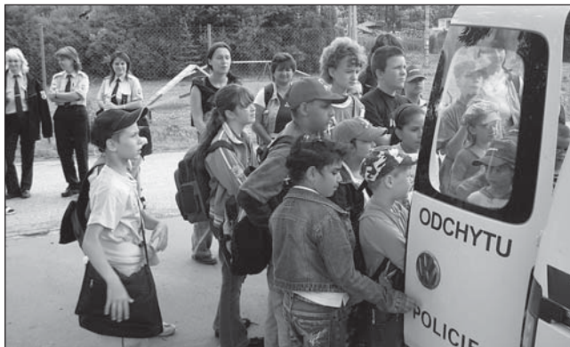
Výlet do Třebovic: Výlet dětských čtenářů knihoven našeho obvodu do Třebovic spojený s návštěvou psiho útulku.

Své otázky mi můžete zaslat na e-mail: zeisberger@marian-skehory.cz nebo předat osobně na podatelně pod heslem: Ptám se... Automaticky však budou vyčleněny všechny otázky pobuřující, urážející a hanlivé.