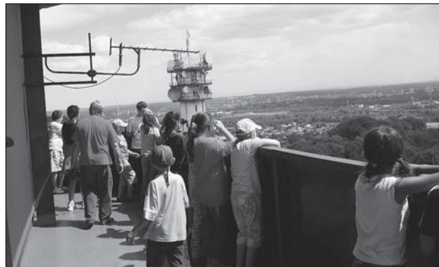
Výlet dětských čtenářů knihoven našeho obvodu za poznáním okolí Ostravy s návštěvou televizní věže v Hoštálkovicích.

Po prázdninách knihovny v Mariánských Horách, Daliborova 9 a Fifejdy, J. Trnky 10 připravily pro čtenáře bohatý program. Opět jsme se zapojily do Evropského týdne mobility 16. 9. – 22. 9. 2008 a začátkem října do Týdne knihoven tentokrát s mottem „Knihovny rodinné střídání“ 6. 10. – 10. 10. 2008.