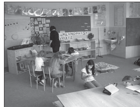
Třídy na ZŠ Praha-Modřany

Cílem Montessori vzdělávání je vychovávat samostatné, schopné a odpovědné lidi, kteří budou mít celý život schopnost správně řešit své problémy.