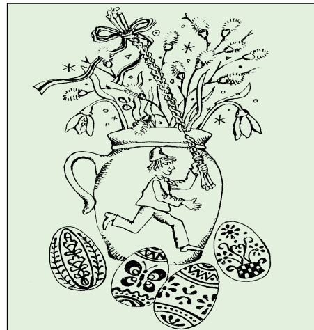
Velikonoce - ilustrační kresba Jindřicha Oleše

Dne 22. 3. 2007 od 13 hodin se koná mimořádné zasedání ZMOB, kde bude projednán nový Jednací řád ZMOB, Jednací řád výboru (finančního a kontrolního) a Zásady hospodaření s byty a Zásady prodeje bytů.