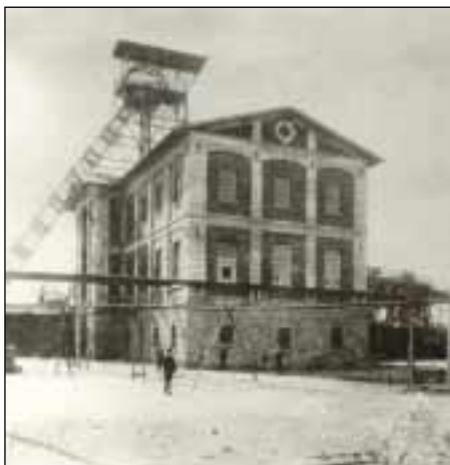
Těžná jáma dolu Ignát z roku 1895.