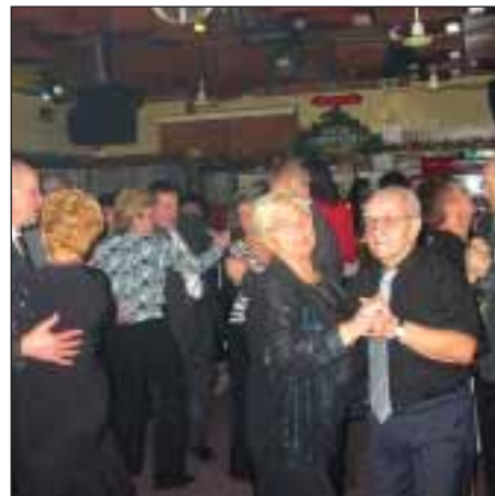
Na tanečním večeru Klubu žen se opravdu tančilo.