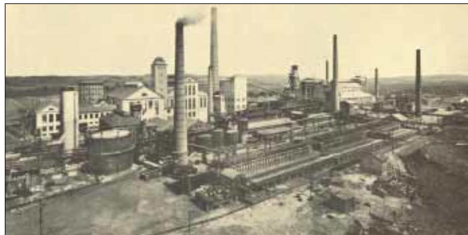
Důl, koksovna a elektrárna Ignác Báňské a hutní společnosti v Mariánských Horách u Moravské Ostravy.