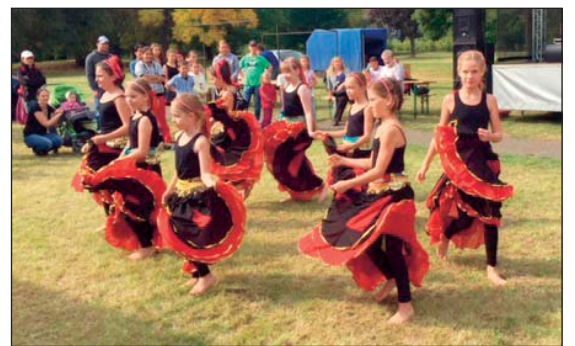
V PROGRAMU vystoupily děti z mateřinek a základní školy.