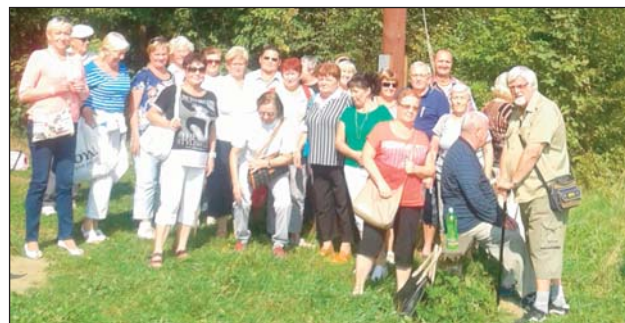
ČTVRTEČNÍ skupina výletníků u zvoničky svaté Barbory.