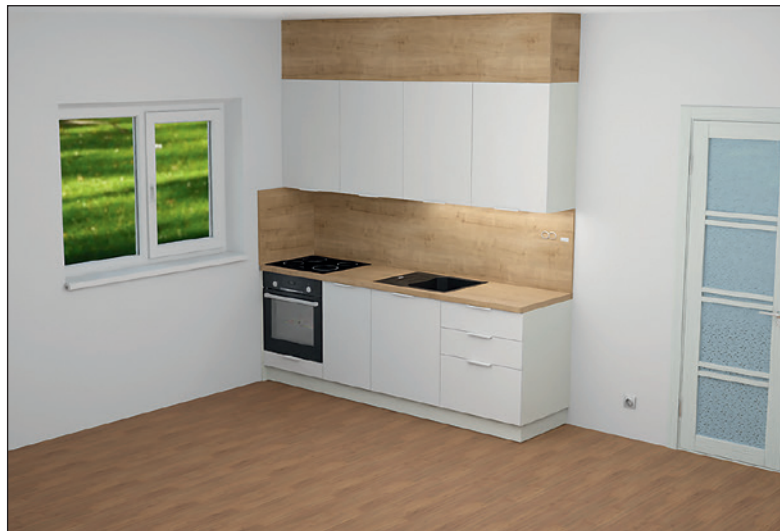
VIZUALIZACE budoucích kuchyní v domě ve Strmé 7: menší byty budou mít linku podél jedné stěny, ty větší nabídnou kuchyň ve tvaru L.

Dokončení rekonstrukce se předpokládá v průběhu července, první nájemníci by se tak mohli do modernizovaného domu nastěhovat ihned po kolaudaci.